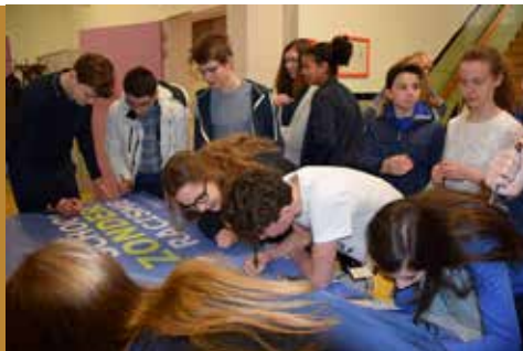
Ondertekening charter School zonder Racisme op BeverZaken-school Sint-Franciscusinstituut Melle

Ook kan er met een charter worden gewerkt rond wereldburgerschap of met een petitie rond antiracisme, die door 60 % van de schoolbevolking moet ondertekend worden. Zo wordt een BeverZaken-school ook meteen een School zonder Racisme.